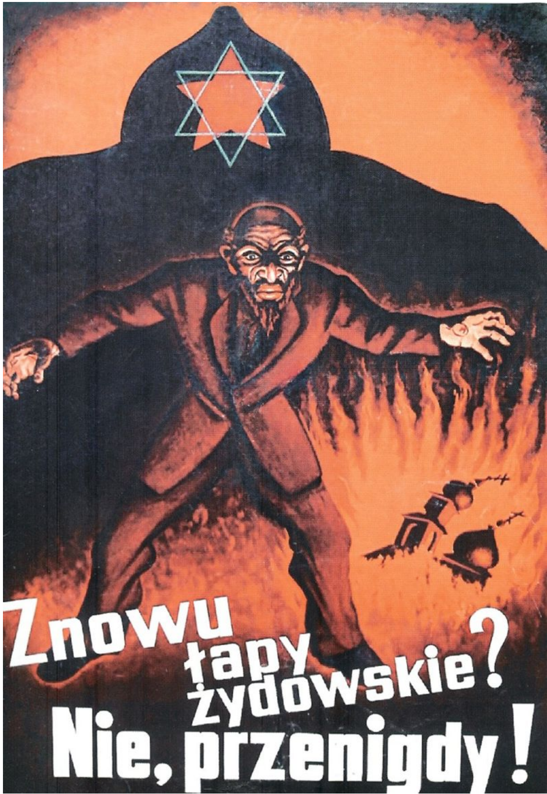
Польский плакат для польских солдат и польского, белорусского и литовского населения: